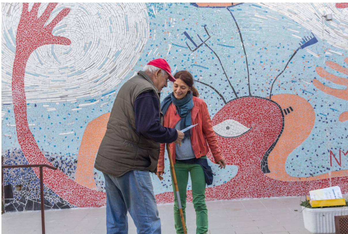
Slika 11: Uručivanje zahvalnica svim sudionicima projekta „Žena Antena i podrška“, Trnsko - Zagreb, 2017.