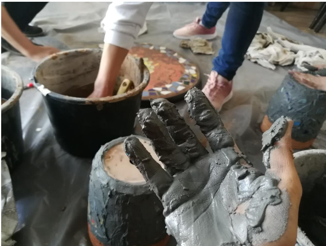
Slike 5 i 6: Različite osobnosti daju prednost različitim segmentima rada u tehnici mozaika