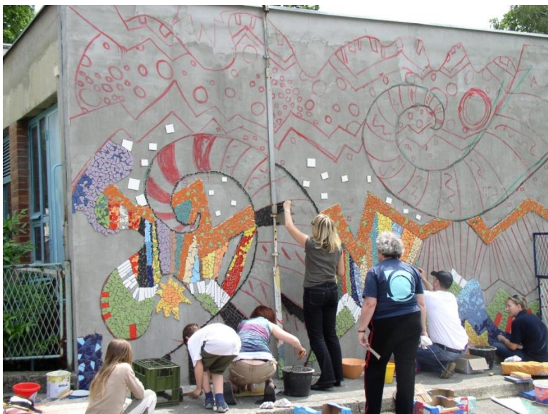
Slika 4: Sudionici različitih dobnih skupina lijepe komadiće keramike na zid, početak izrade mozaika, vrtić Vrapče, Zagreb, 2008.

Ovakav složen radno-likovni proces pruža mogućnost osobama različitih sklonosti da se izraze i sudjeluju u stvaranju zajedničkog rada na način koji im najbolje odgovara. Kroz evaluacijski razgovor pojedinci mogu doći do uvida o dijelovima svoje osobnosti koje je osvijetlio sam proces rada. Npr. ima pojedinaca koji teško pristaju na razbijanje neoštećene keramičke pločice na dijelove, dok ima i onih koji izuzetno uživaju u tom postupku i na koje on djeluje oslobađajuće. Ova činjenica može potaknuti grupu na razgovor o osobnim razlozima koji se kriju iza takvih različitosti. Također, različite osobnosti će na različit način graditi mozaik. Netko će pomno tražiti dijelove koji savršeno naliježu jedan uz drugi a prostore između zapunjavat će milimetarskim komadićima pločica, dok će netko drugi manje birati i prigodaovati dijelove a inzistirat će na brzini rada. Suradnja različitih osobnosti na zajedničkom radu poticajna je tema za razgovor.