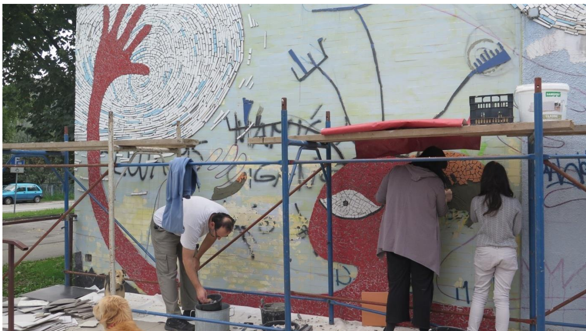
Slika 9: Stanovnici Trnskog samoinicijativno se pridružuju umjetničko-društvenoj akciji izrade mozaika „Žena Antena i podrška“, Trnsko - Zagreb, 2017.