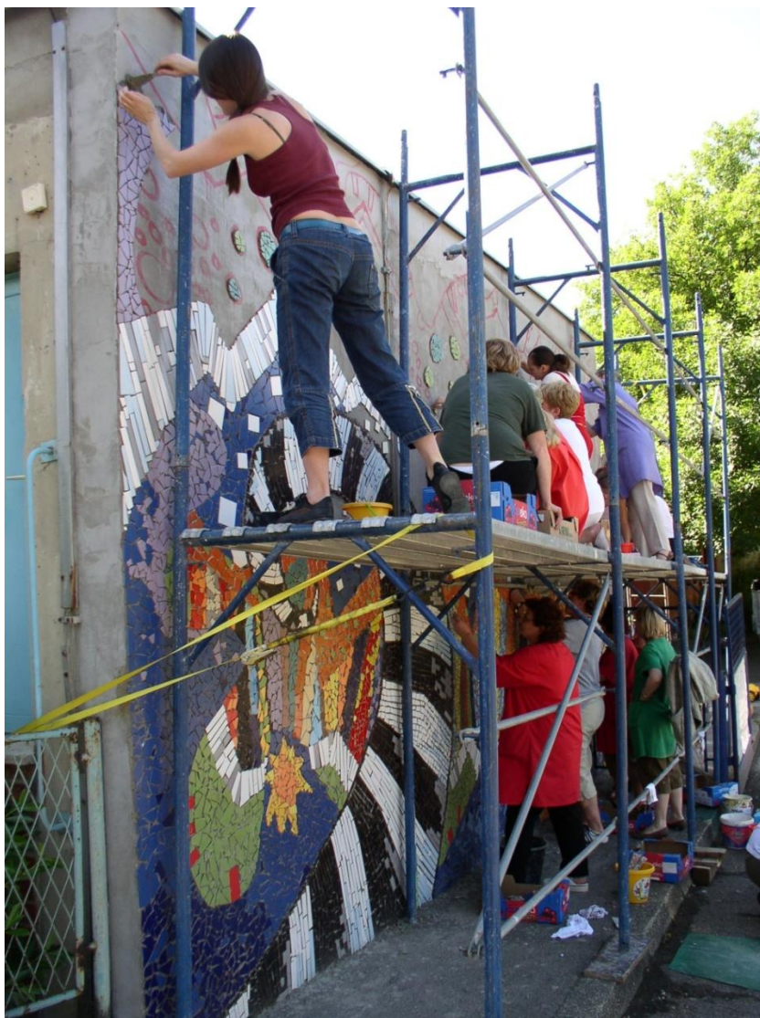
Slika 1: Rad na skeli, odgojiteljice i roditelji djece koja pohađaju vrtić Vrapče, Zagreb, 2008.