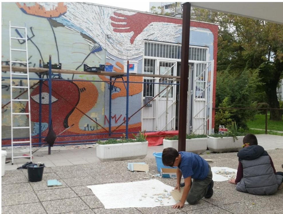
Slika 8: Lokalna djeca se samoinicijativno pridružuju umjetničko-društvenoj akciji izrade mozaika - razbijanje pločica čekićem, „Žena Antena i podrška“, Trnsko - Zagreb, 2017.

Adolescenti, među kojima je i skupina migranata dobivaju priliku biti pozitivan primjer zajednici što je poticajno za populaciju koja je u potrazi za vlastitim identitetom. Migranti dobivaju priliku povezati se s vršnjacima i s lokalnom zajednicom te ukloniti etikete koje im zajednica iz straha i neznanja nameće. Radom u zajednici i sklapanjem poznanstava raste mogućnost integracije te uspostave pozitivnog stava o sebi i okolini. Informiranje zajednice o temi i simboličkom prikazu, a pogotovo uključivanje njezinih članova u izradu mozaika, objedinjuje kulturne različitosti putem umjetnosti. Mozaik je izuzetno trajna tehnika pa će rad sastavljen od tisuće keramičkih komadića još godinama podsjećati sudionike i zajednicu na snagu ustrajnosti i zajedništava bez obzira na porijeklo autora.