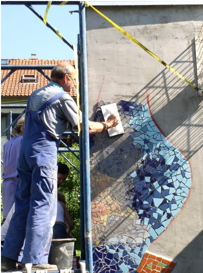
Slika 7: Fugiranje sa skele, vrtić Vrapče, Zagreb, 2008.

U evaluacijskom razgovoru članovi grupe iznose svoje iskustvo vezano za postupak fugiranja i čišćenja mozaika. Neka od pitanja koja se mogu pojaviti vezana su uz teme pedantnosti, predanosti, fizičke snage, odnosa prema prljavštini i sl.