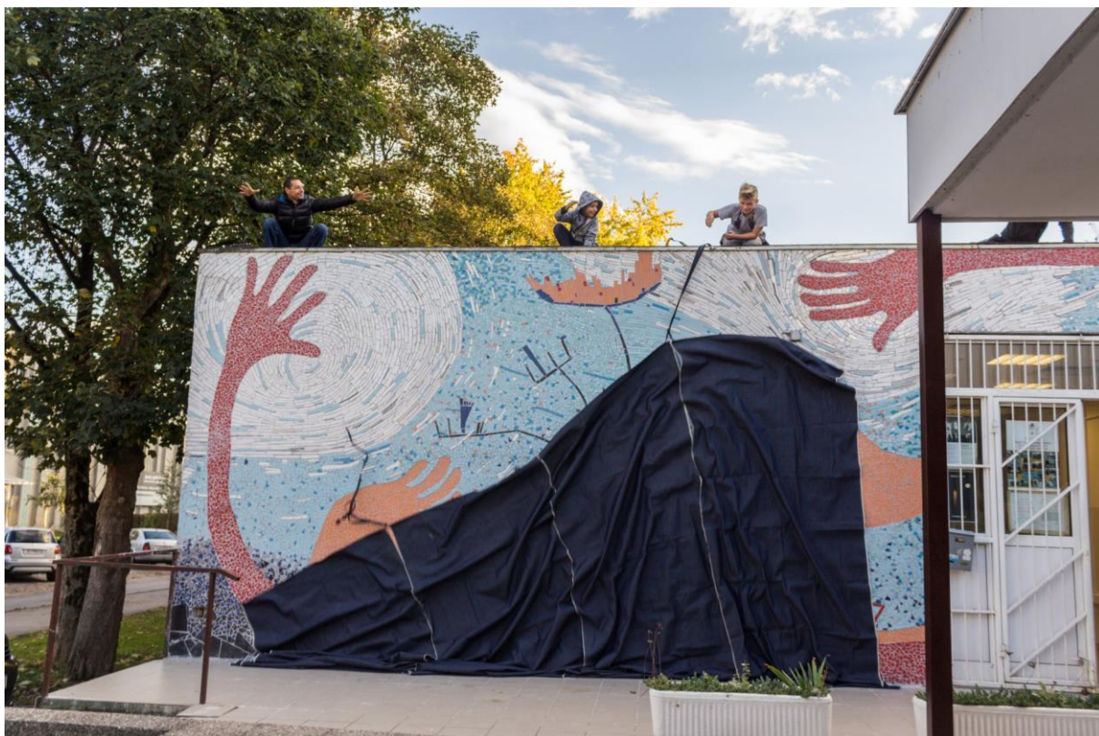
Slika 10: Djeca sudjeluju u otvorenju mozaika, „Žena Antena i podrška“, Trnsko - Zagreb, 2017.