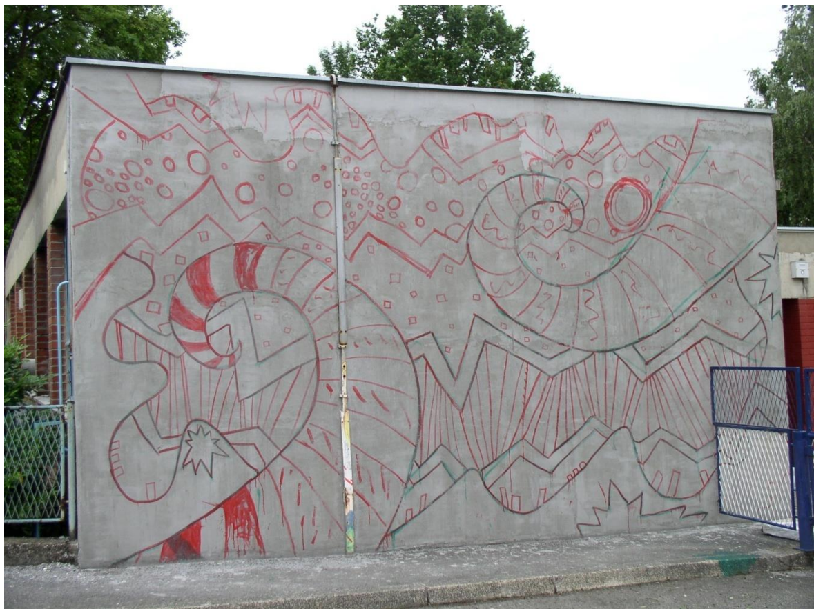
Slika 3: Skica za zidni mozaik na vrtiću „Vrapče“, Zagrebu, 2008.

Kroz ovaj postupak svatko od članova grupe dobiva priliku iskazati poštovanje i podršku tuđem simbolu/identitetu kao i asertivno zaštititi svoj simbol/identitet ako osjeti da je „ugrožen“.