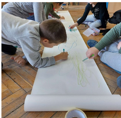
Slika 3. Pronađi me u šari uz psa