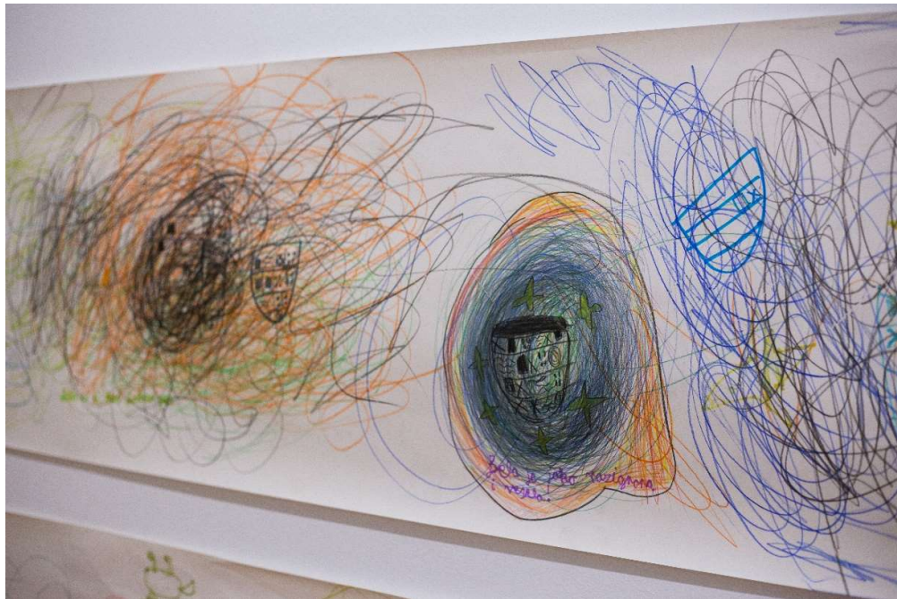
Slika 6. Radovi u projektu „Muzejske priče i jedna njuška“