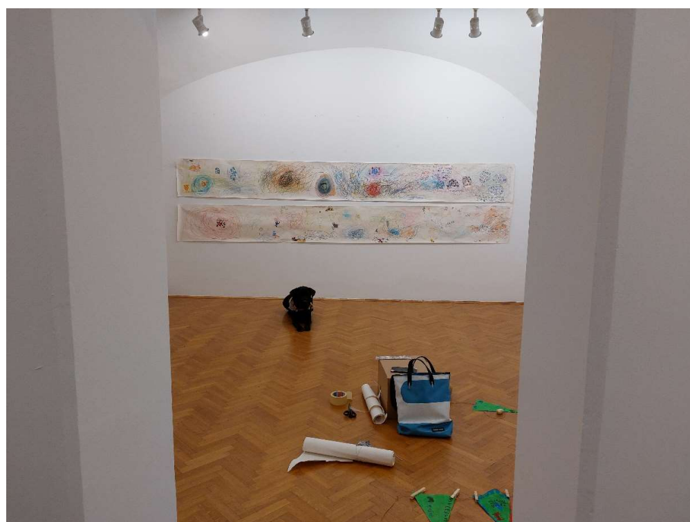
Slika 8. Bella i radovi u pripremi za virtualnu izložbu, Bella je zadovoljna