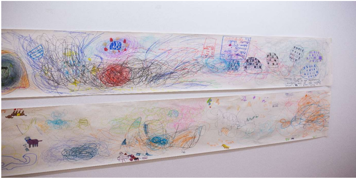
Slika 5. Radovi u projektu „Muzejske priče i jedna njuška“